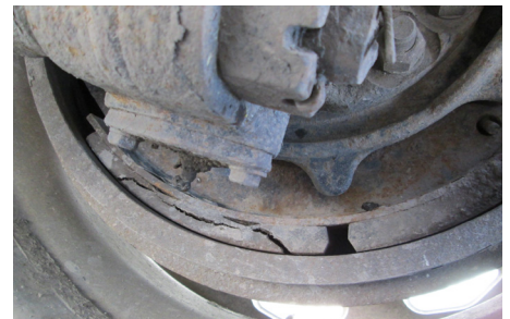
Forro de balata agrietado. OOSC, Parte II, a.(5)(c)iii / 393.47(a)-U.S.