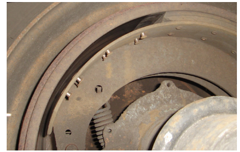
Bloque de forro de balata faltante. OOSC, Parte II, a.(5)(c)ii / 393.47(a)-U.S.