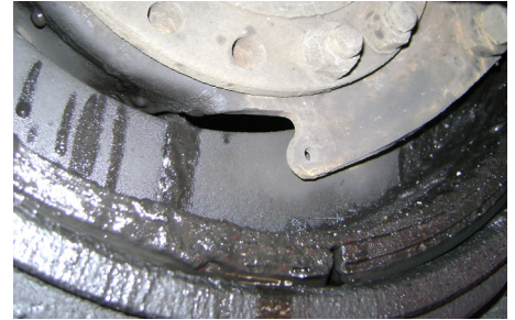
Forro de balata contaminada. OOSC, Parte II, a.(5)(c)vi / 393.47(a)-U.S.