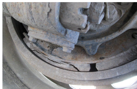
Garniture fissurée. M.H.S., Partie II, a.(5)(c)iii / 393.47(a)-U.S.