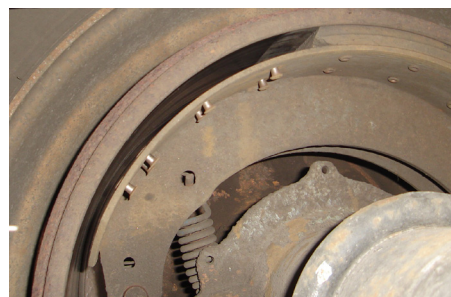
Bloc de garniture manquant. M.H.S., Partie II, a.(5)(c)ii / 393.47(a)-U.S.