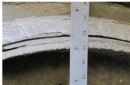
Garnitures usées. M.H.S., Partie II, a.(5)(c)vii / 393.47(d)(2)-U.S.