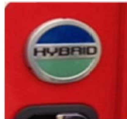
Figure 3 : Exemple de logo : Cercle bleu et vert « hybrid » Installé sur la portière du camion par le manufacturier d'origine

La figure 4 est une démonstration de ce qui peut être inscrit sur le camion par le propriétaire/exploitant.