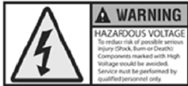
Figure 6 : Exemple d'étiquette Danger Haut Voltage

Pour l'inspecteur, la présence d'une enveloppe externe d'un conduit électrique de couleur orange ou d'isolation orange sur un câble électrique (voir figure 7 ) est un indicateur qu'un véhicule commercial fonctionne à haut voltage.