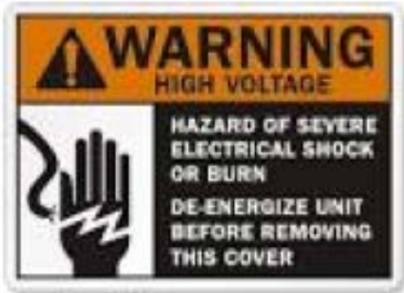
Figure 5 : Exemple d'étiquette Danger Haut Voltage

L'inspecteur peut aussi déterminer que le véhicule fonctionne à haut voltage s'il rencontre les logos suivants sur certains compartiments du véhicule. (Figures 5 et 6)